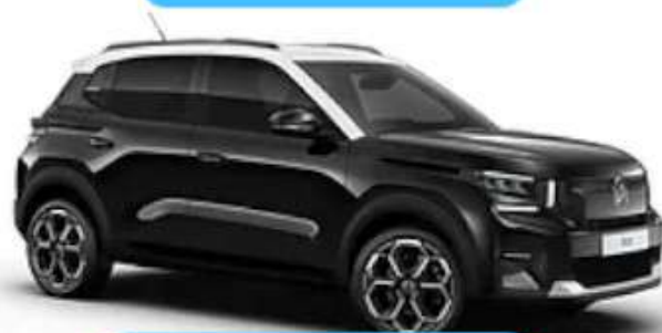
Noir Perla Nera