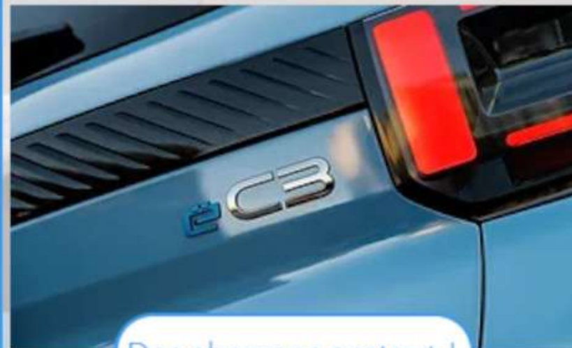
Des chevrons partout !

La Citroën C3 inaugure le nouveau style de la marque et notamment sa nouvelle signature visuelle qui met fin aux projecteurs à double étage. Composée de trois lames leds, deux horizontales et une verticale, cette nouvelle signature visuelle se retrouve à l'arrière et se montre unique sur le marché.