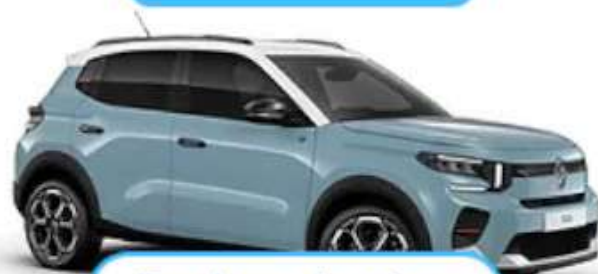
Bleu Monte Carlo